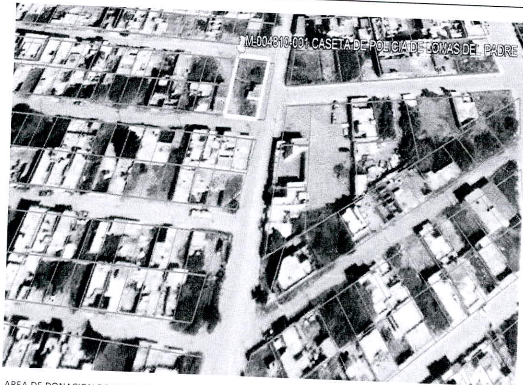
AREA DE DONACION DE LA MANZANA 7 CON UNA SUPERFICIE DE 620.76 M2