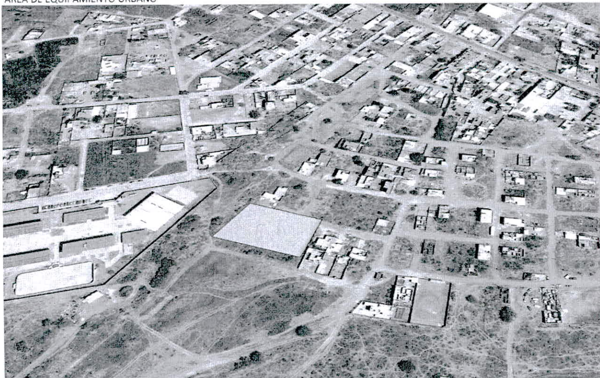
AREA DE EQUIPAMIENTO URBANO