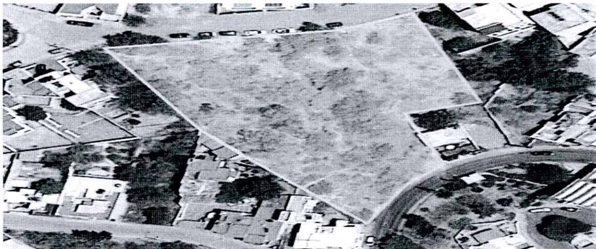
CALLE DE ARRIBA SECCION H SAN JAVIER