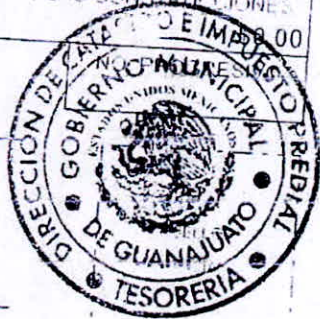
EXHIBIT DATE BY 1 10/1/80 STH